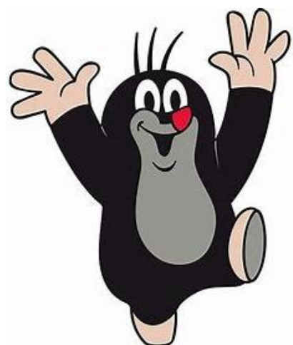
Klasse 4 Maulwurf