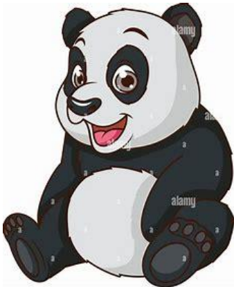
Klasse 1 b Panda