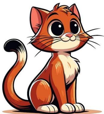
Klasse 3 Katze