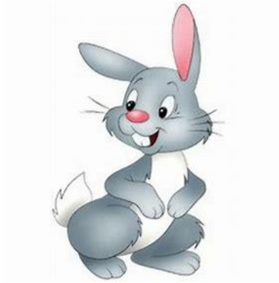
Klasse 1 a Kaninchen